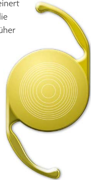
Abbildung: AcrySof® IQ ReSTOR® Kunstlinse

Der Linsenkern wird zerkleinert und abgesaugt, um dann die Kunstlinse einzusetzen. Früher musste der Arzt das Auge aufschneiden und mit winzigen Instrumenten bearbeiten. Heutzutage können die meisten Schritte mithilfe eines Lasers durchgeführt werden, klingenfrei und äußerst präzise, da computergesteuert.